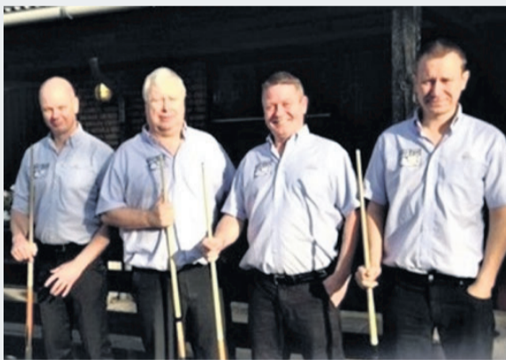
HSBK's 2. divisionshold.