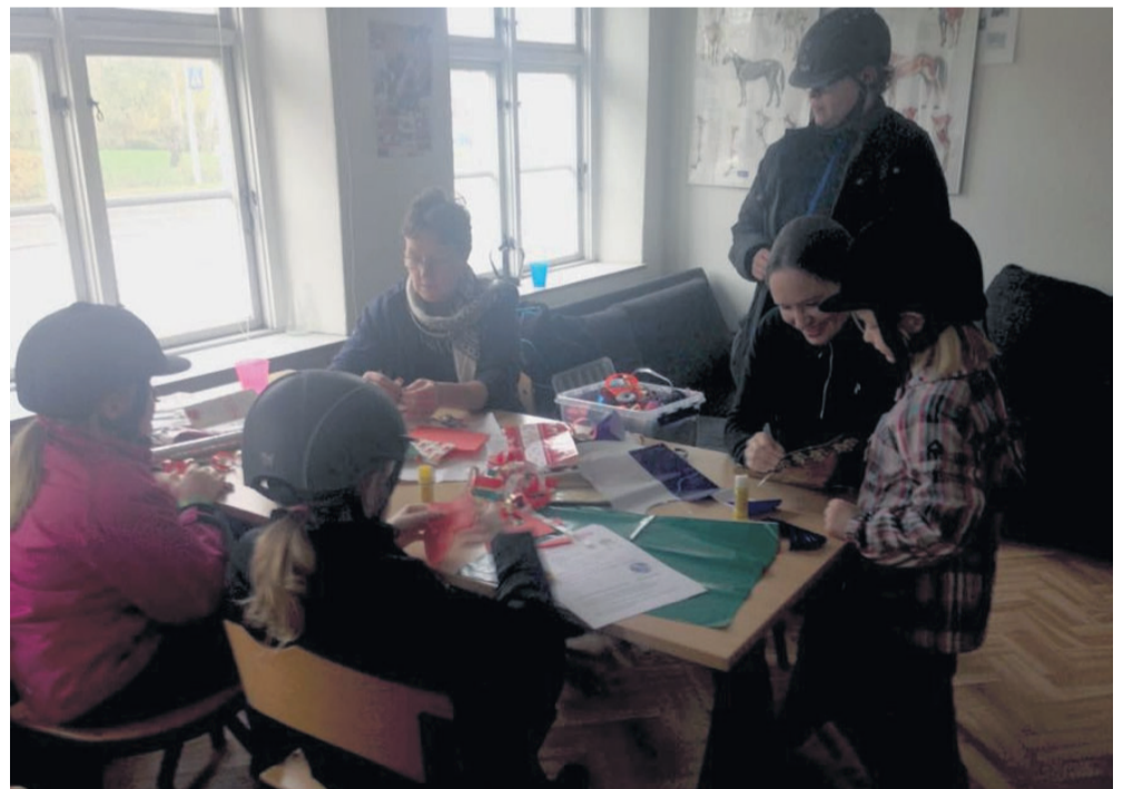
Hygge med julepynt i NØR.

Ventetiden mens en rytter blev testet i teori og praktik, blev udnyttet med at lave julepynt til NØR's juletræ, når der er Lucia og juleopvisning den 3. de-